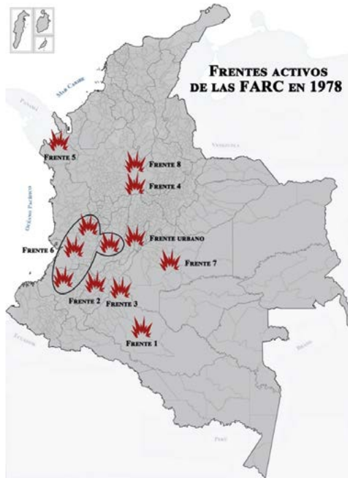
Mapa 1. Frentes de las FARC en 1978