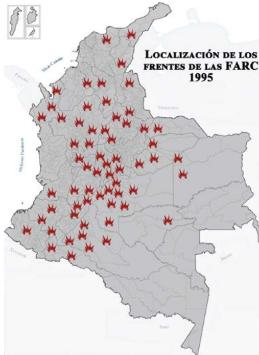
Mapa 2. Frentes de las FARC-EP en 1995

Posteriormente, en los años ochenta, las FARC comenzarían a expandirse militar y territorialmente hacia zonas de gran presencia de cultivo de cocaína, significando esto un gran ingreso económico y, por consiguiente, la ampliación de sus frentes en número, pasando de nueve a dieciocho.