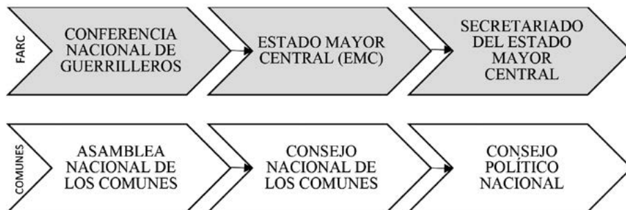
Figura 1. Comparativa de la estructura organizativa de la guerrilla de las FARC-EP con la estructura organizativa partidaria del partido político FARC